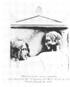
Ἐπιτύμβιος ἀγάλματ' ἀναθηρῶν ἀποθανόντων ἐν τῇ ἀκροπόλει τῆς Ἀθῆναι.