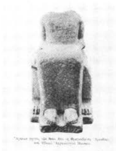
Ἐπιτύμβιος ἀγάλματ' ἀναθηρῶν ἀποθανόντων ἐν τῇ ἀκροπόλει τῆς Ἀθῆναι.