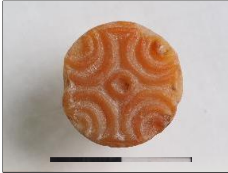
Fig. 1 Stone seal from Dhaskalio Trench A Εικ.1 Σφραγίδολιθος από το Δασκαλειό