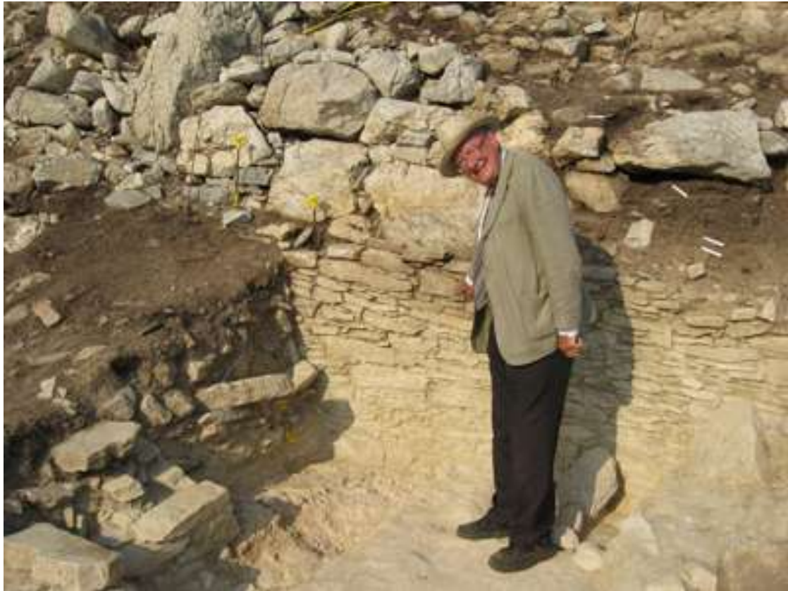
Εικ. 2 Ο ανασκαφέας στον οικισμό του Δασκαλιού κατά τη διάρκεια της ανασκαφής.