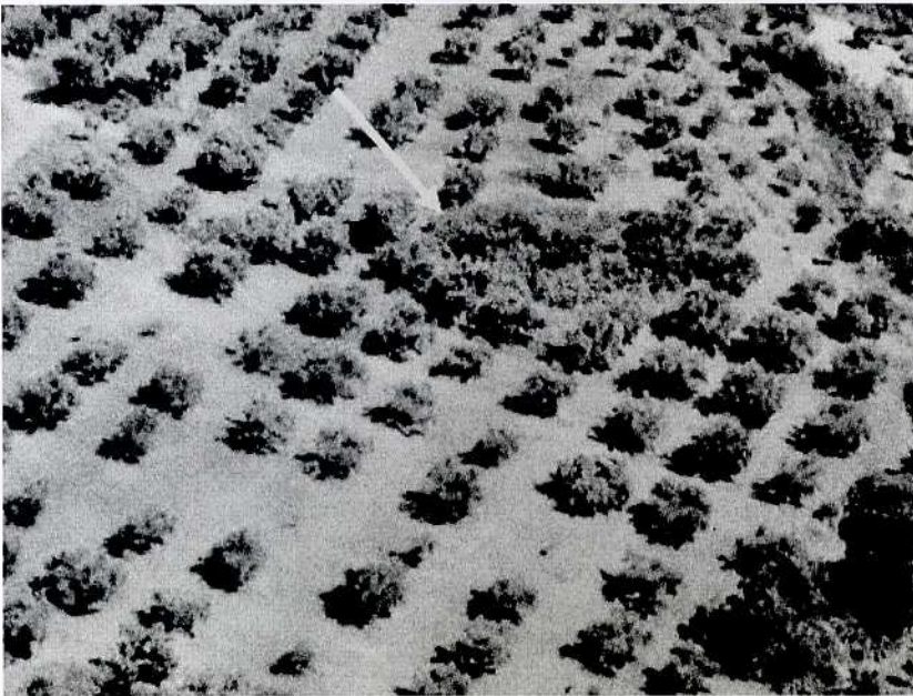
32 Ἀεροφωτογραφία τῆς θέσης Τραγάνες ἀπό ΒΑ. Ὁ τύμβος σημειώνεται μέ λευκό βέλος.

Κατά τόν κ. Κοσμόπουλο τά ἐπιφανειακά εὐρήματα τοῦ 2005 ἐπιτρέπουν τήν ταύτιση τοῦ μυκηναϊκοῦ κέντρου τῆς Κουκουνάρας μέ ἕναν ἀπό τούς ἐννέα μεγάλους οἰκισμούς τῆς «Δεῦρο» ἐπαρχίας, πού μνημονεύονται στίς πινακίδες τοῦ