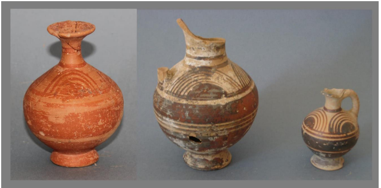
Fig. 1. Submycenaean vases from Naxos Εικ. 1. Υπομυκηναϊκά αγγεία από την Νάξο