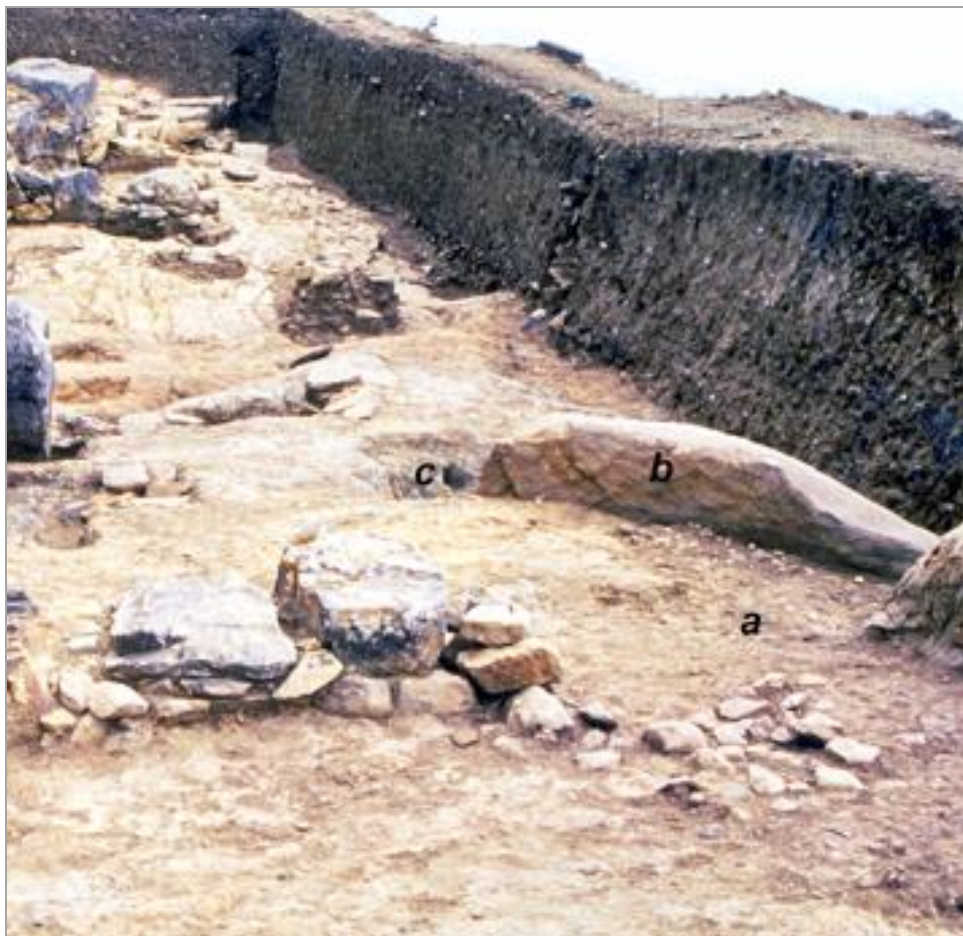
Fig. 2. Place of ancestral or hero cult at Xobourgo on Tenos Εικ. 2. Χώρος προγονολατρείας ή ηρωολατρείας στο Ξώμπουργο Τήνου