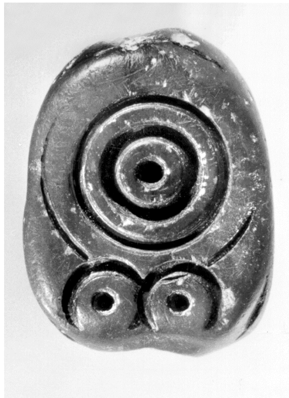
Fig. 2. Middle Minoan seal from Ayia Irini settlement on Keos Εικ. 2. Μεσομινωική σφραγίδα από τον οικισμό της Αγίας Ειρήνης στην Κέα