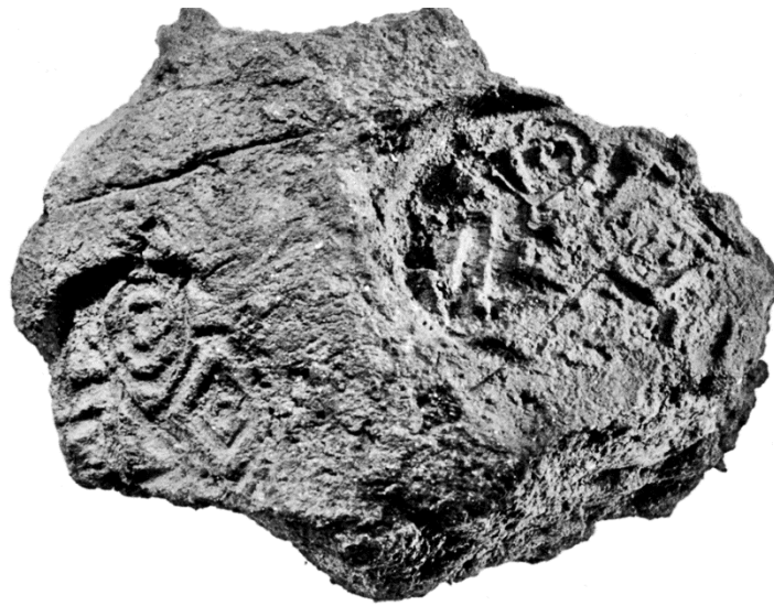
Fig. 1. Sealing from Zas Cave on Naxos Εικ. 1. Σφράγισμα από το σπήλαιο του Ζα στη Νάξο