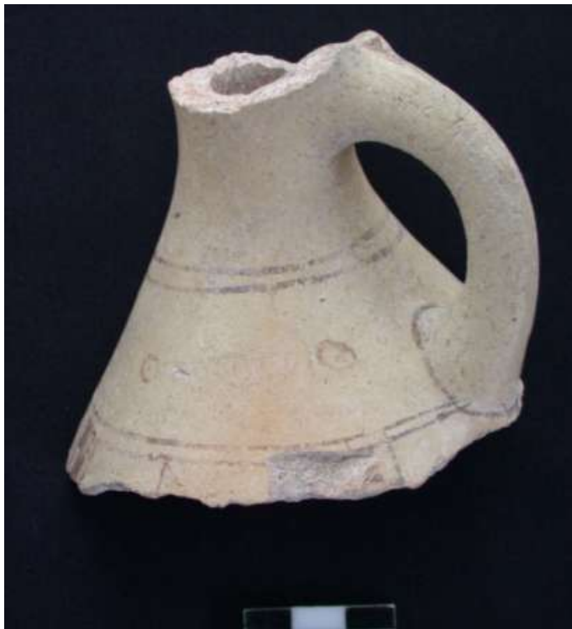
Fig. 2 White slipped Jug - Cycladic Import at Çeşme - Bağlararası (2nd Millennium BC) Εικ. 2 Πρόχους με λευκό επίχρισμα - Κυκλαδική εισαγωγή στο Çeşme-Bağlararası (2η χιλιετία π.Χ.)