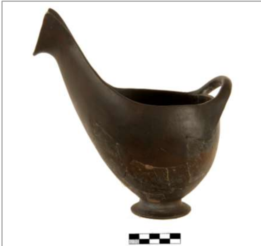
Fig. 1 Sauceboat - Cycladic import at Liman Tepe (3rd Millennium BC) Εικ. 1 Κύμβα – Κυκλαδική εισαγωγή στο Liman Tepe (3η χιλιετία π.Χ.)