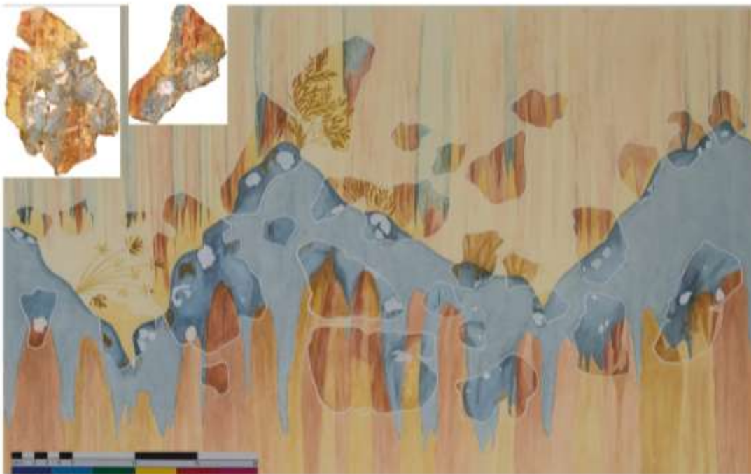
Fig. 4 Reconstruction of the rocky landscape, plus photographs of two of the fragments.

Εικ. 3 Οπτικοποίηση ενός από τα πλοία και θραύσμα που εικονίζει τμήμα πλοίου διακοσμημένου με δελφίνια καθώς και το σχέδιο μελέτης του.