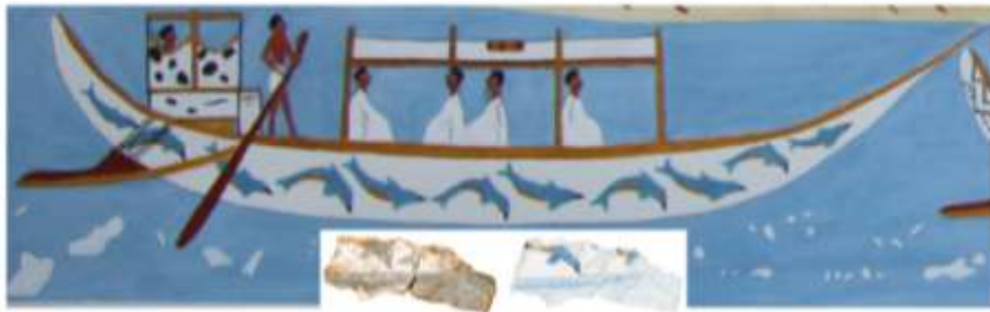
Fig. 3 Visualization of one of the ships, plus a photograph of the fragment of hull with dolphins.

Εικ. 2 Θραύσμα τοιχογραφίας που εικονίζει άνδρες και τρίποδες και το σχέδιο μελέτης του.