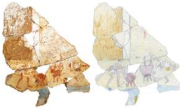
Fig. 2 Fragment of men with cauldrons, plus study drawing.

Εικ. 2 Θραύσμα τοιχογραφίας που εικονίζει άνδρες και τρίποδες και το σχέδιο μελέτης του.