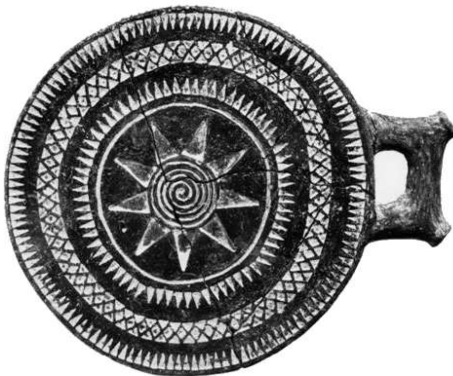
Εικ. 1 Πάνω Κουφονήσι, Νεκροταφείο Αγριλιάς: Πήλινο τηγανόσχημο πλοίο Fig. 1 Pano Kouphonisi, Agrilia cemetery: Clay 'frying pan'