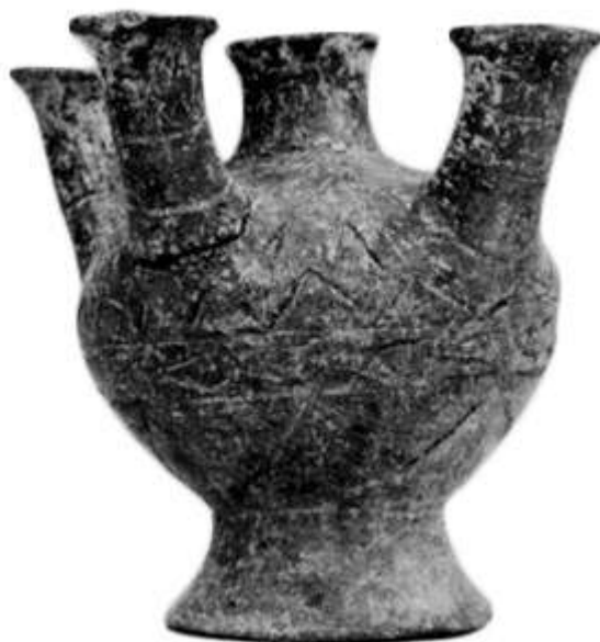
Εικ. 2 Κάτω Κουφονήσι: Πήλινος «Λύχνος» Fig. 2 Kato Kouphonisi: Clay 'lamp'