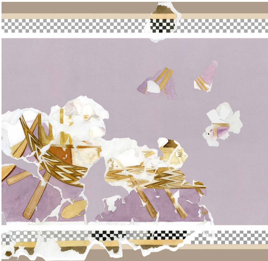
Fig. 2 Reconstruction of the ship with zig-zag pattern on its hull (Rosemary Robertson, 2013)

Εικ. 1 Θραύσμα τοιχογραφίας με παράσταση πλοίου που διακοσμείται με ενάλληλες γωνίες στα πλευρά του. Ανάκτορο του Νέστορος, Αίθουσα 64