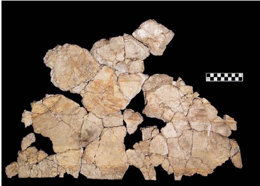
Fig. 1 Fragment of wall-painting with representation of ship with zig-zag pattern on its hull. Palace of Nestor, Hall 64.

Εικ. 1 Θραύσμα τοιχογραφίας με παράσταση πλοίου που διακοσμείται με ενάλληλες γωνίες στα πλευρά του. Ανάκτορο του Νέστορος, Αίθουσα 64