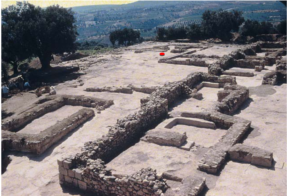
Fig. 3 The Palace of Nestor with Hall 64 where the wall-painting of the 'Pylian fleet' has been found (Blegen excavation photo)

Εικ. 3 Το ανάκτορο του Νέστορα με την Αίθουσα 64, όπου βρέθηκε η τοιχογραφία του «Πυλιακού Στόλου» (από το φωτογραφικό αρχείο των ανασκαφών Blegen)